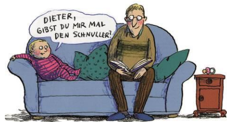
© Anke Kuhl, aus „Alles Familie!“, Klett Kinderbuch, 2013

Familienbildungsstätte Selm / Katholisches Bildungsforum Coesfeld