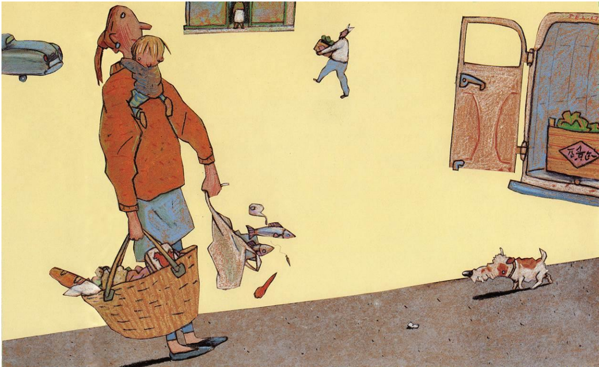
© Wolf Erlbruch, aus „Leonard“, Peter Hammer, 2005