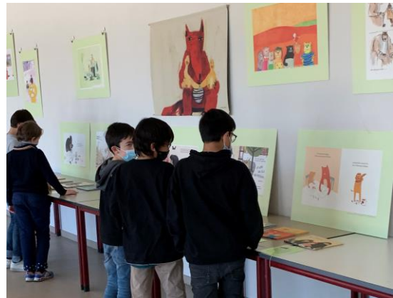
Schüler in der Ausstellung an der Schule „Am Sand“ in Luxemburg

27. Oktober - 24. November: Katholisches Bildungsforum Rhein-Erft, Bergheim