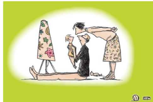
Ill. von Philip Waechter, aus „Sohntage“, © 2008 Beltz & Gelberg, Weinheim

Posterausstellung im Familienzentrum des Landratsamts Haßberge