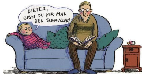
© Anke Kuhl, aus „Alles Familie!“, Klett Kinderbuch, 2013

06. November - 22. Dezember: Fachakademie für Sozialpädagogik der Ev. Diakonissenanstalt Augsburg