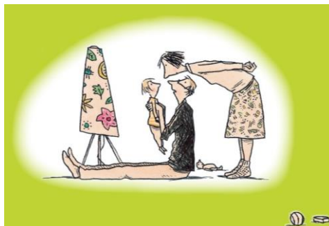
Ill. von Philip Waechter, aus „Sohntage“, © 2008 Beltz & Gelberg, Weinheim

05. Oktober 2019 - 30. September 2020: Posterausstellung im Familienzentrum des Landratsamts Haßberge