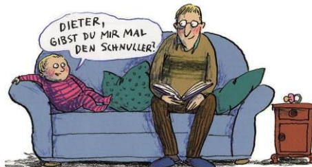
© Anke Kuhl, aus „Alles Familie!“, Klett Kinderbuch, 2013

06. November - 22. Dezember: Fachakademie für Sozialpädagogik der Ev. Diakonissenanstalt Augsburg