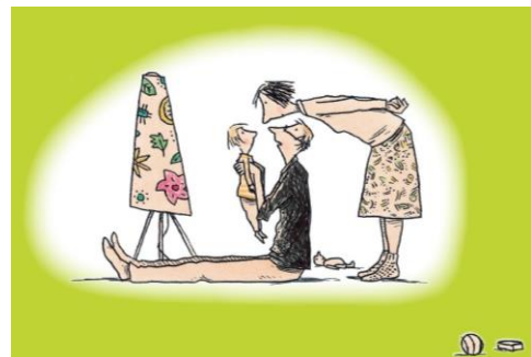
Ill. von Philip Waechter, aus „Sohntage“, © 2008 Beltz & Gelberg, Weinheim

Posterausstellung im Familienzentrum des Landratsamts Haßberge